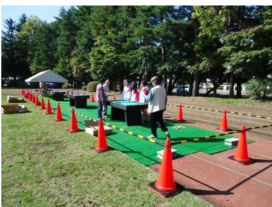
今回はグラウンドでした。準備中