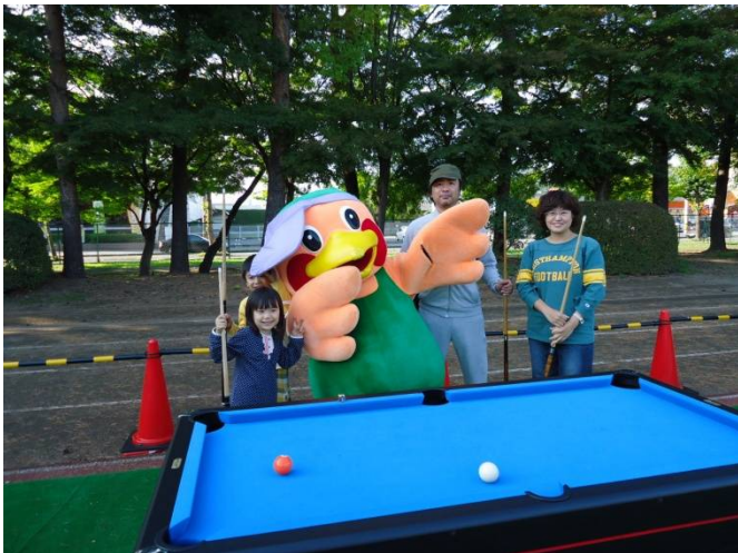
岩手の県鳥「きじ丸」くんも来てくれました。