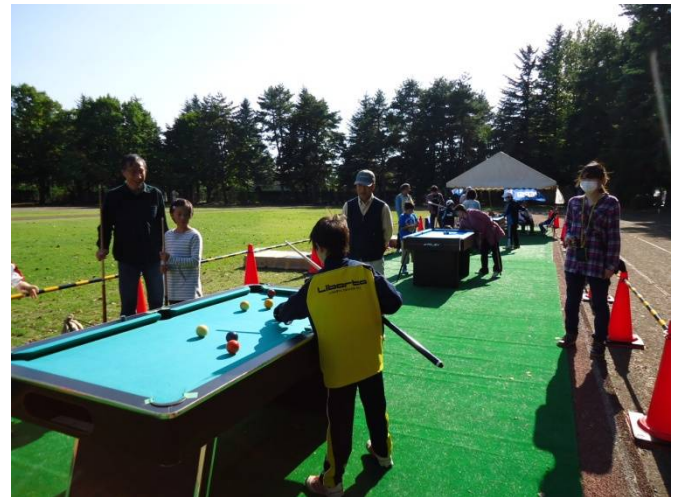
3世代仲よくビリヤード