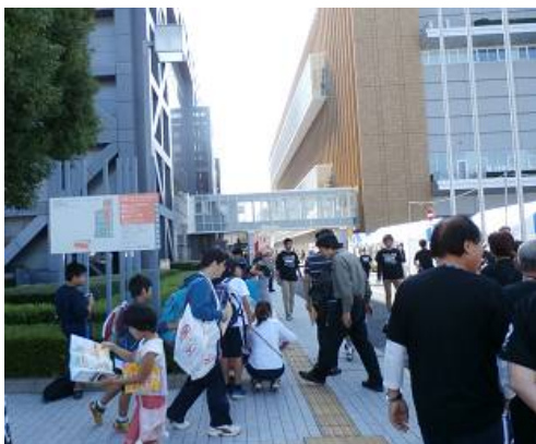
左 国立スポーツ科学センター

主催 文部科学省・日本スポーツ振興センター・日本体育協会・日本オリンピック委員会 日本レクリエーション協会・日本オリンピックズ協会・読売新聞社 平成 25 年 10 月 14 日