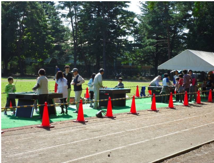
青空の下親子連れでビリヤード体験