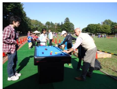
ミニだけど楽しい